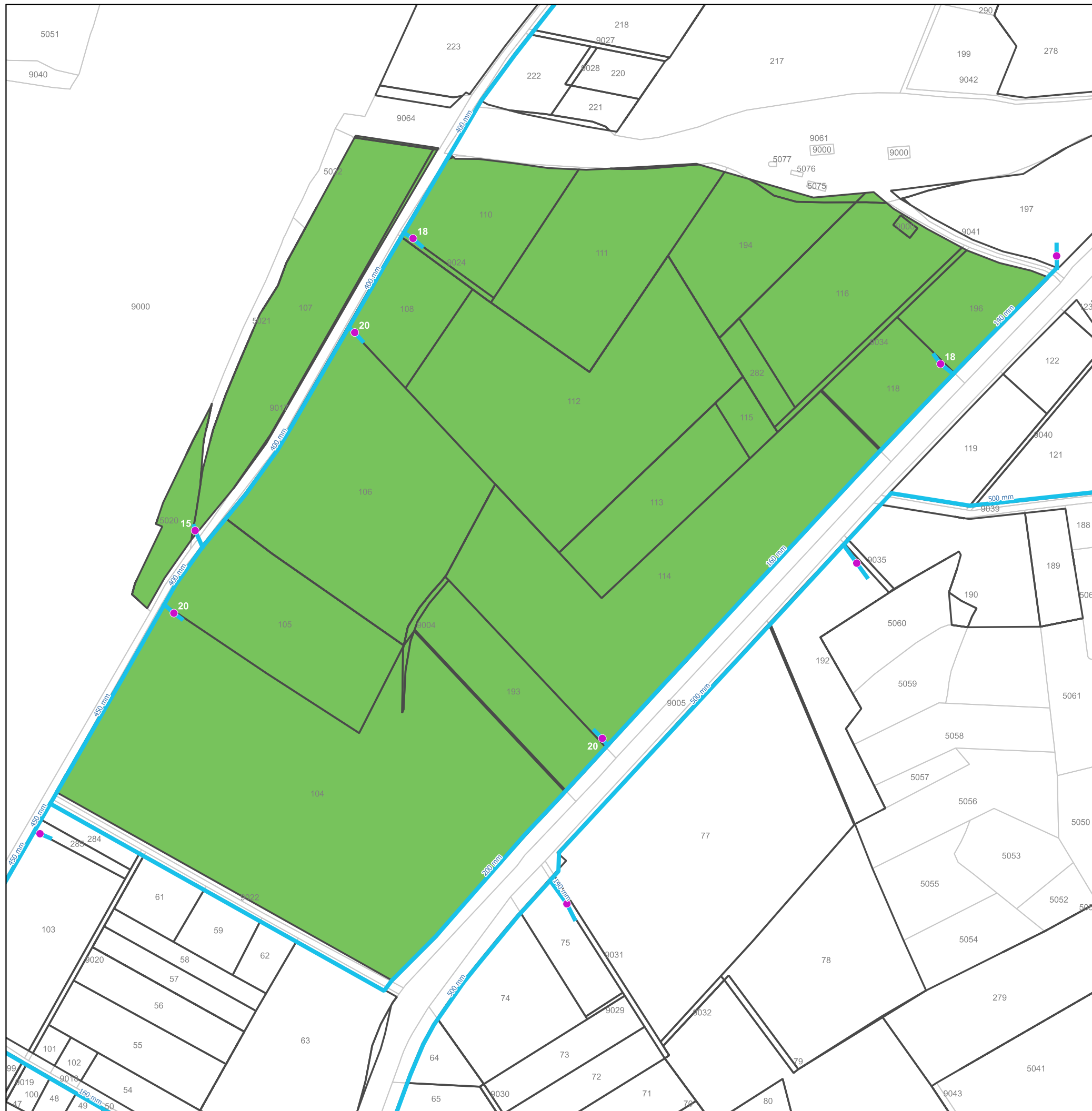
DETALLES REGADÍO DE CASTRONUÑO (VALLADOLID)