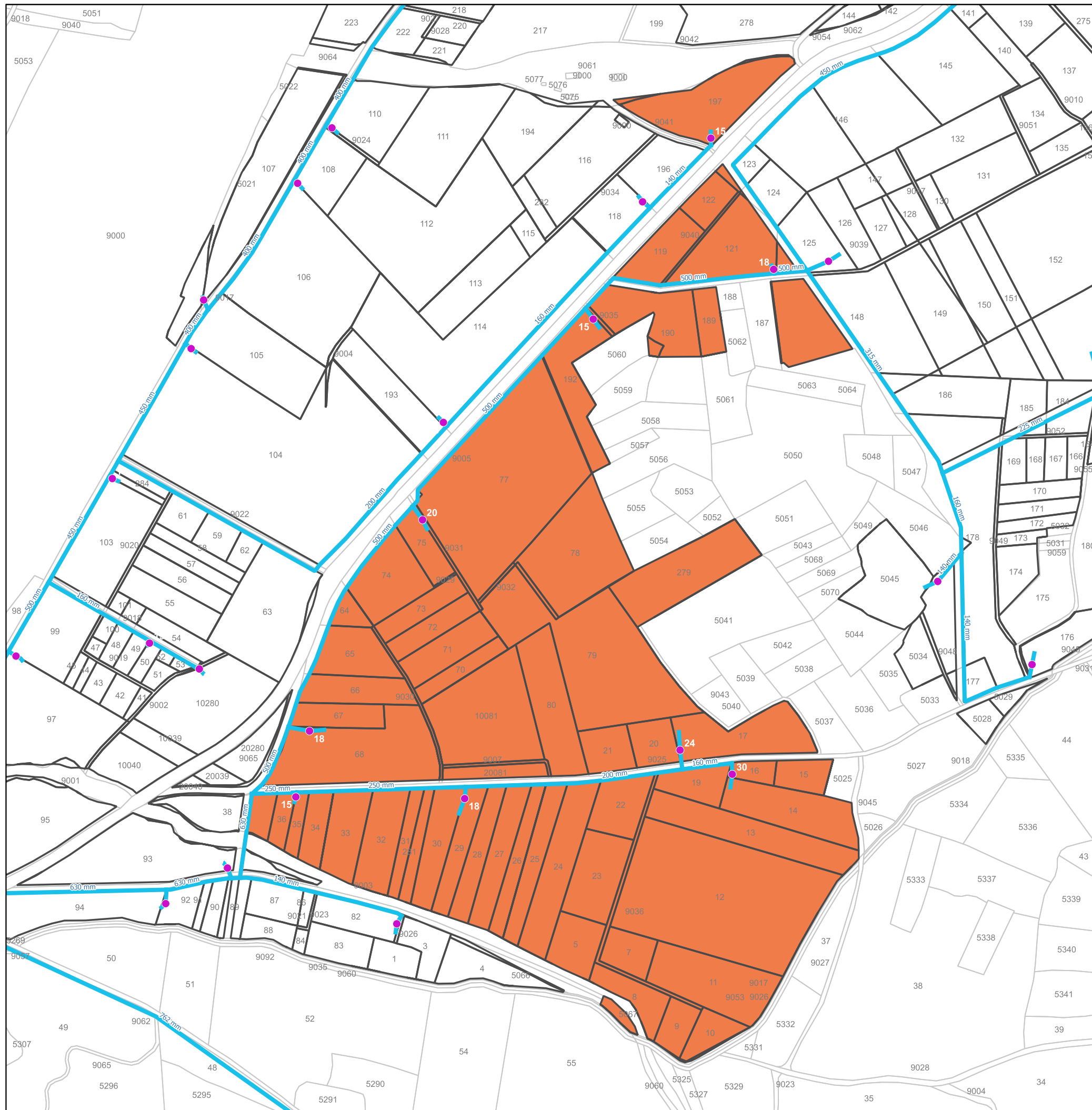
DETALLES REGADÍO DE CASTRONUÑO (VALLADOLID)